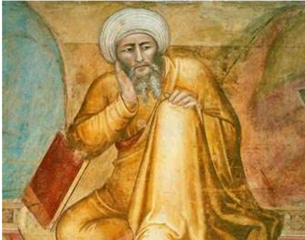
(Abu-I Walid Muhammad ibn Rusd, Averroes en forma latinitzada; Còrdova, 1126 - Marrakech, 1198)