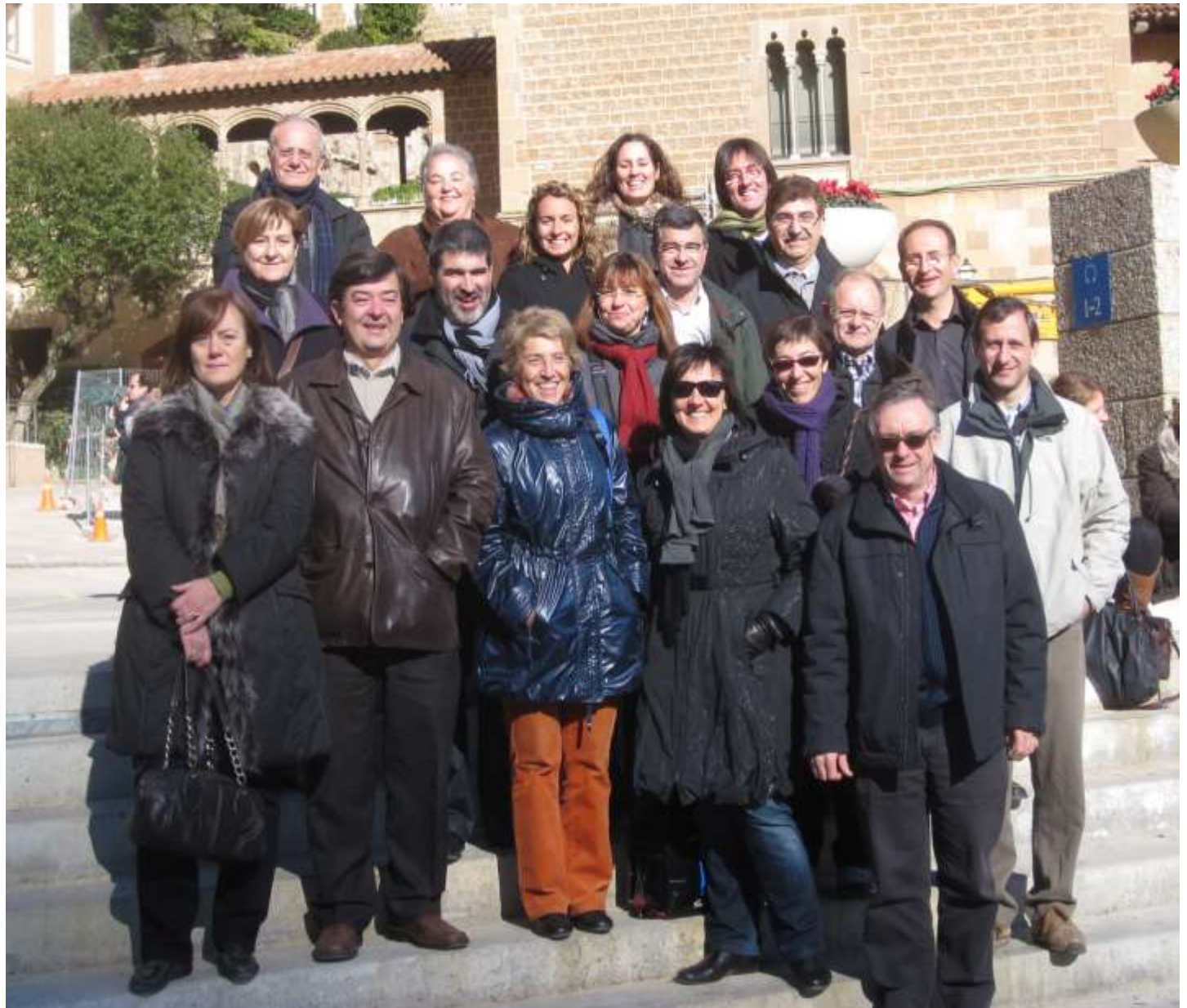
Associació del Bages i Berguedà per a l'Estudi dels Lípids. www.abel.cat